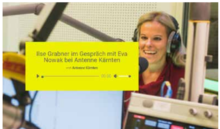
22 minütiges Antenne Radio Interview zum Thema Motivation, Flow und Wertschätzung